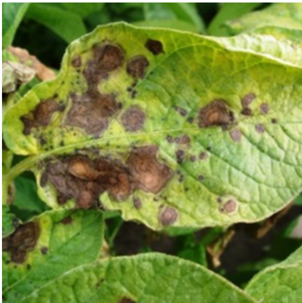
Dürrflecken (konzentrische Ringe)

In Mitteleuropa findet man in Kartoffeln zwei Alternaria-Arten: A. alternata und A. solani . Eine sichere Unterscheidung der Arten ist anhand von Symptomen im Feld nicht möglich. A. alternata tritt in der Vegetationsperiode meist früher auf als A. solani . Beide Arten werden an Kartoffeln mit Befalls-Symptomen nachgewiesen, wobei A. solani der relevantere Erreger ist und deutlich größere Schäden verursacht als A. alternata . Somit gelten Erkenntnissen zur Wirkung von Fungiziden sowie möglicher Resistenzsituationen zu A. solani besondere Aufmerksamkeit.