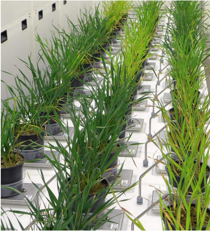
Vieles im Labor ist automatisiert. Hier eine Wiegeeinrichtung zur Bestimmung der Pflanzentranspiration nach unterschiedlichen Düngergaben.