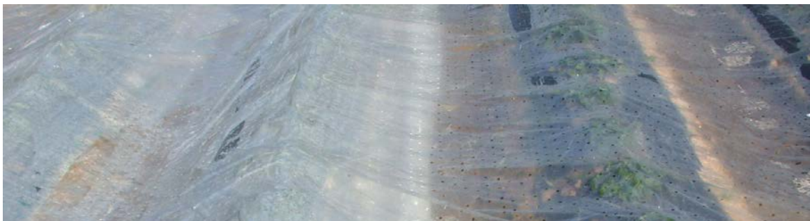
Einfach- und Doppelabdeckung im Vergleich

Achtung! Wenn die Blüten direkt an der Folie bzw. am Vlies anstehen, wirkt die Temperatur direkt auf diese Blüten und es kann trotz Abdeckung zu Frostschäden kommen. Bei Strahlungswetterlagen mit hohen Temperaturunterschieden zwischen Tag und Nächten mit Frost muss die Folie bzw. das Vlies wieder abgenommen werden.