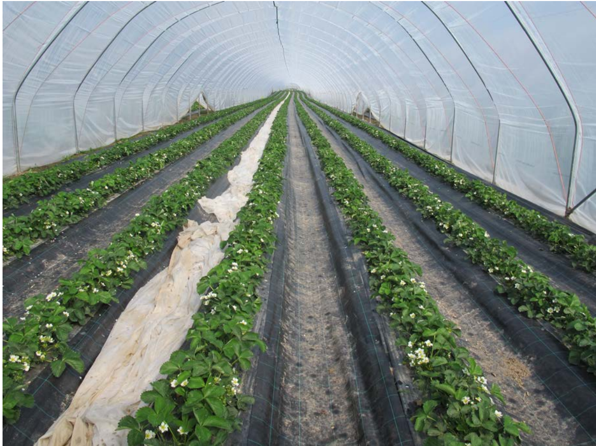
Erdbeeren im Folientunnel

Zusätzlicher Aufwand an Arbeitskräften: Aufgrund der frühen Pflanzenentwicklung im Wandertunnel müssen allein für Lüften und Kontrollen 120 bis 150 Stunden pro Hektar kalkuliert werden.