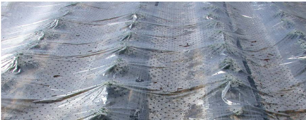
Taubildung unter der Abdeckung

Achtung! Durch Taubildung sind die Bedingungen für Mehltau infektionen ebenfalls günstig, so dass auch Behandlungen notwendig werden.